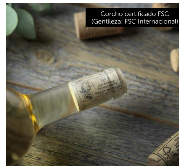
Corcho certificado FSC