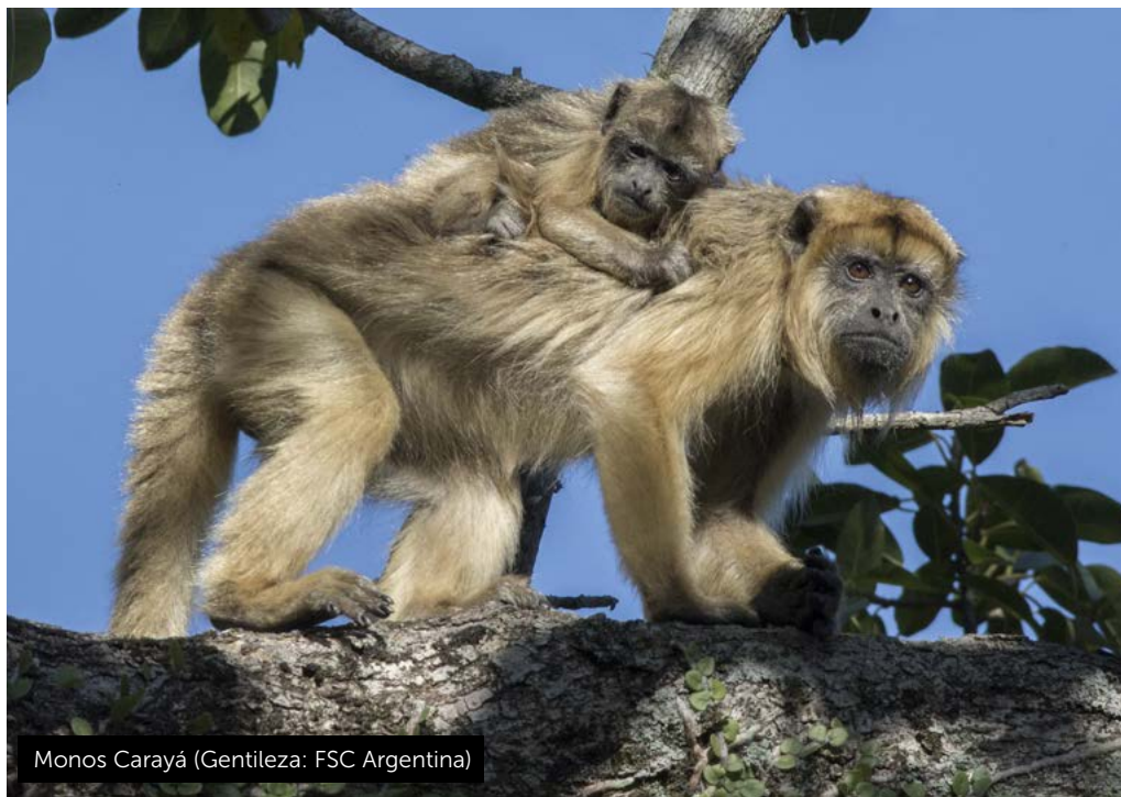
Monos Carayá