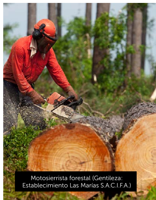
Motosierrista forestal