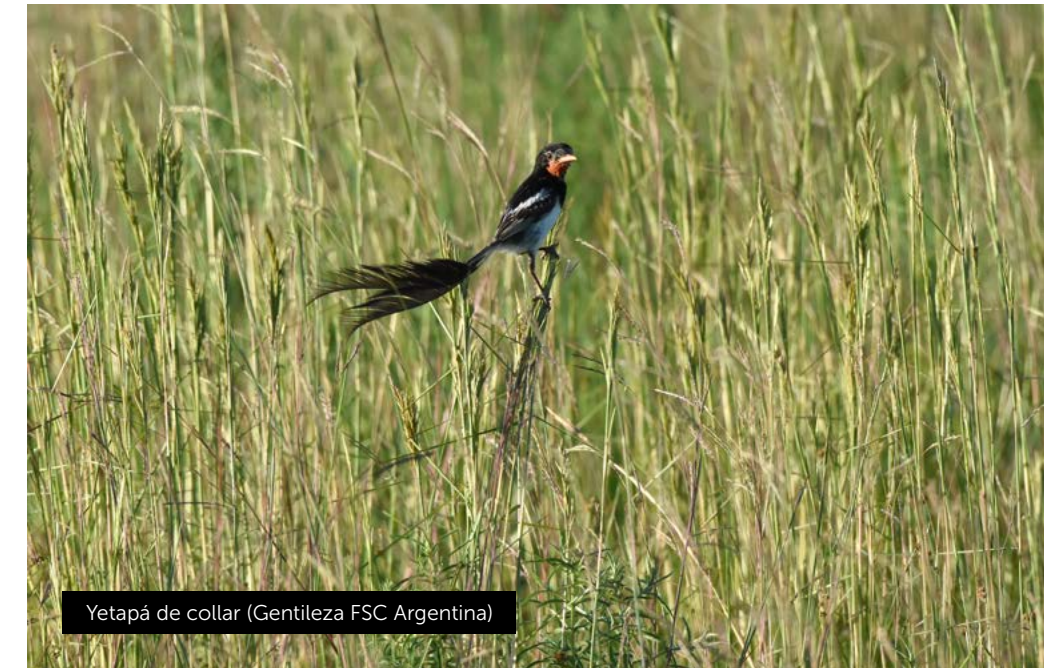
Yetapá de collar

Mirá a tu alrededor, en tu casa, en la oficina, en el supermercado. Estás rodeado de objetos que provienen de bosques nativos y plantaciones forestales: muebles, cuadernos, sobres, corchos, embalajes de papel y cartón... todos los materiales de origen forestal pueden tener la certificación FSC®.