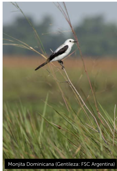
Monjita Dominicana