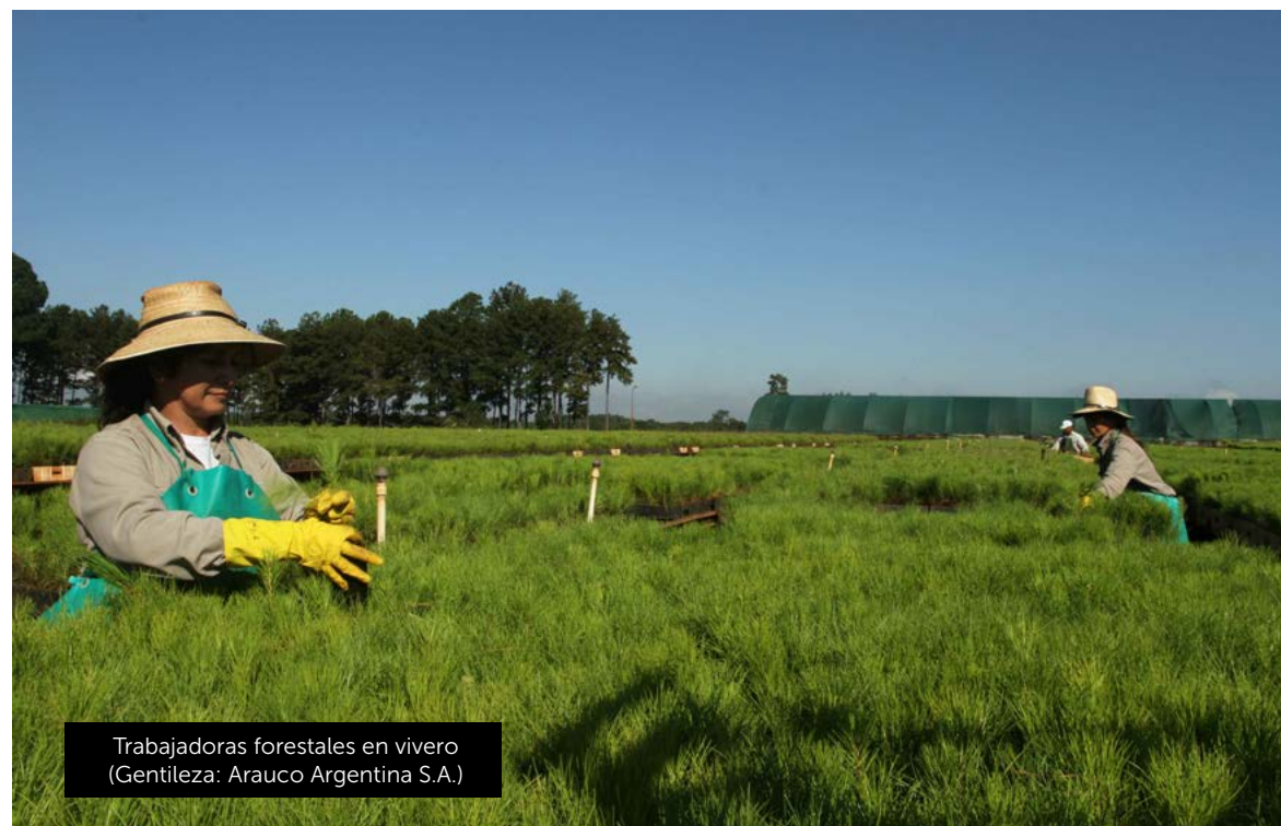
Trabajadoras forestales en vivero

Para identificar y gestionar adecuadamente los valores ambientales (suelo, agua, biodiversidad) de mayor fragilidad, las normas del FSC exigen que se realicen consultas a autoridades, universidades, investigadores, ONGs, vecinos, etc. La información se va construyendo de manera colectiva a través de procesos de consulta.