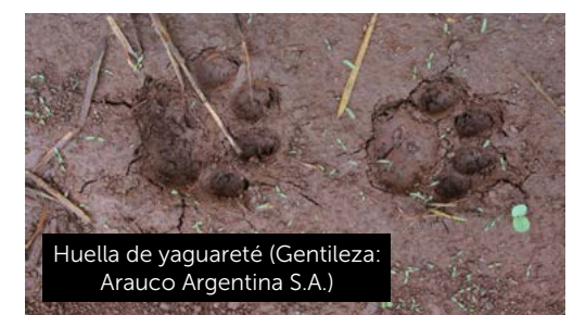
Huella de yaguareté

Para conocer más acerca de FSC, ingresá en nuestra web https://ar.fsc.org/ y si tenés consultas o comentarios, nuestro correo es: info@ar.fsc.org . (FSC® F000234)